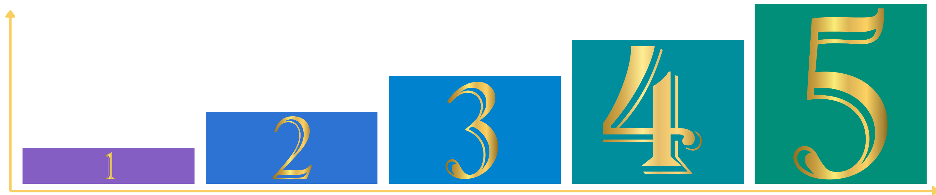
Figura 1 - Conceito de qualidade das IES

O último credenciamento da UFS ocorreu no ano de 2010, em que a instituição obteve nota 3, de uma faixa de 1 a 5 (Figura 1). Neste interstício nossa Universidade passou por algumas transformações oriundas, especialmente, pela ampliação da oferta de cursos (graduação e pós-graduação), além da implementação do Campus do Sertão e a criação do Centro de Ciências Agrárias Aplicadas (CCAA). Em 2024, a visita virtual in loco ocorreu entre os dias 5 e 7 de fevereiro, resultando no relatório de avaliação - elaborado pela Comissão do INEP - que comprovou o desenvolvimento da UFS durante esses 14 anos, culminado num Conceito Institucional com a nota máxima.