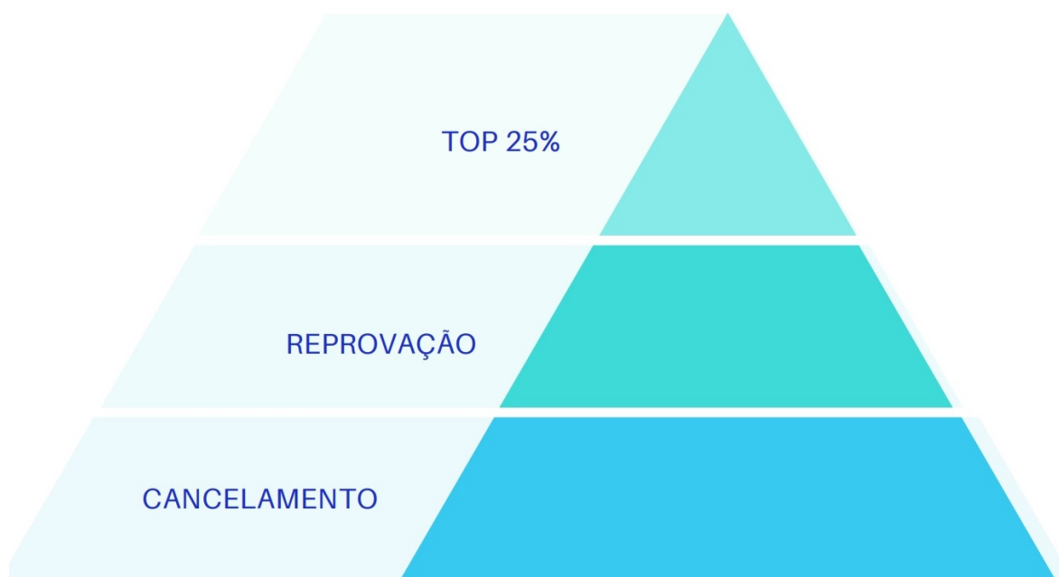
Figura 1: Pirâmide de ameaças potenciais à evolução da taxa de sucesso - UFS

O texto possui três partes, além desta introdução e dos encaminhamentos. Inicia descrevendo o comportamento da taxa de sucesso, entre 2010 e 2021 e o volume de alunos necessários para atingir taxa de sucesso alcance 55%. Centra atenção no grupo de alunos que já concluíram entre 75% e 99% da carga horária mínima do curso (top 25%), e mostra que a contribuição de cada departamento é plenamente factível, dado que existem excedente de alunos de 3 a 5 vezes alunos no público alvo. Na terceira parte, descreve o número de cancelamentos de matrículas. A quarta parte apresenta números sobre reprovação na mesma disciplina e chama atenção para a necessidade de proteção institucional contra essa prática de tal forma a evitar que 45 alunos reprovem 10 ou mais vezes na mesma disciplina.