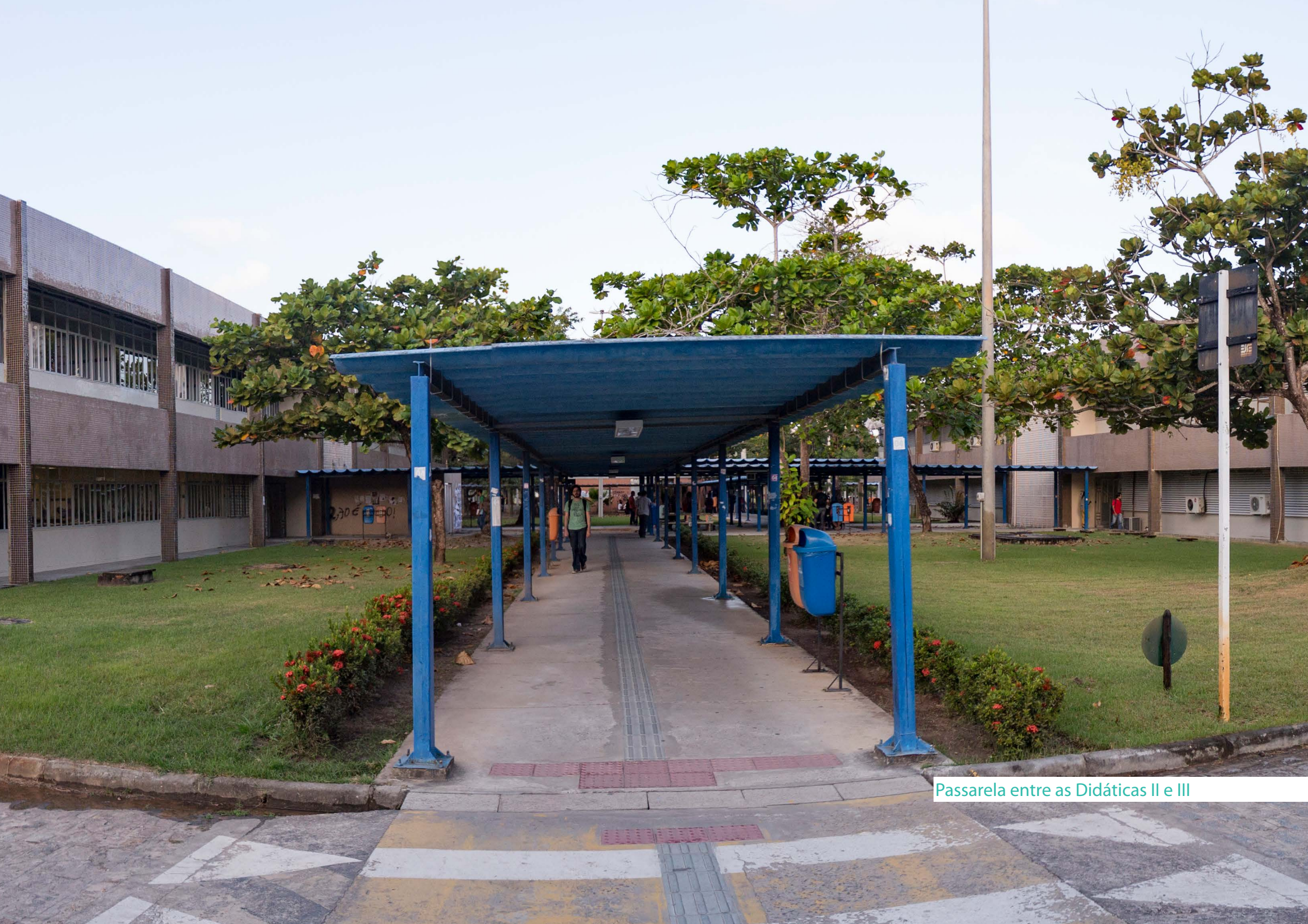
Passarela entre as Didáticas II e III